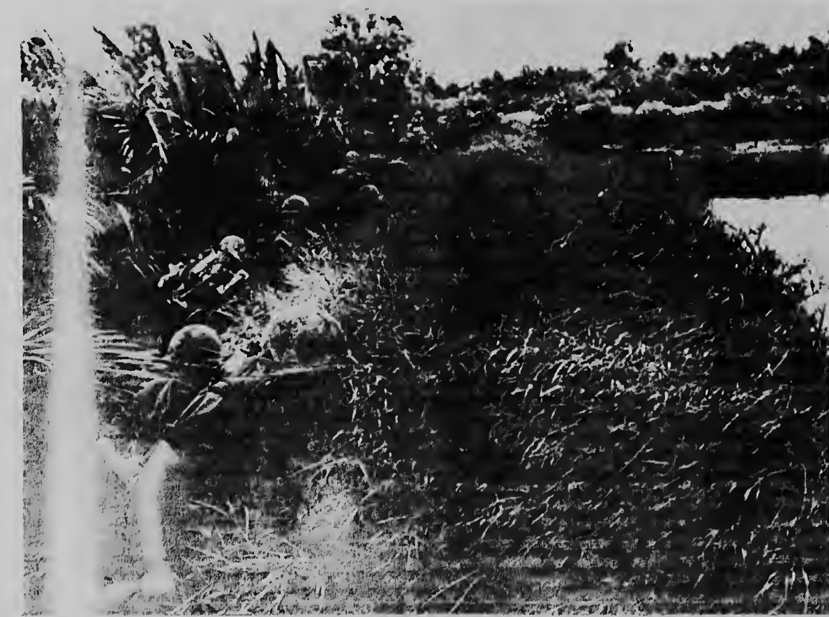
Un soldado mericano ta escondiendo tras di yerba haltu durante un ataque contra un fortaleco comunista na provincia Kien Hoa. E ataque tabata parti di un operacion masha grandi qu nan ta teniendo pa caber e comunistanan.